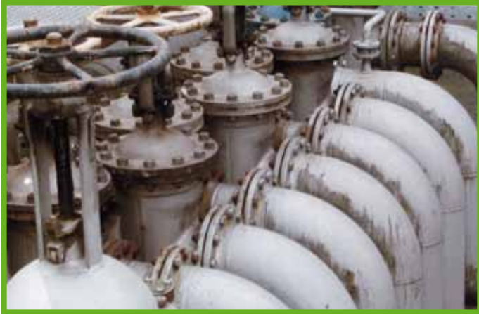
Enge Rohrverlegung und breite Rohrtrassen erschweren Montagearbeiten.