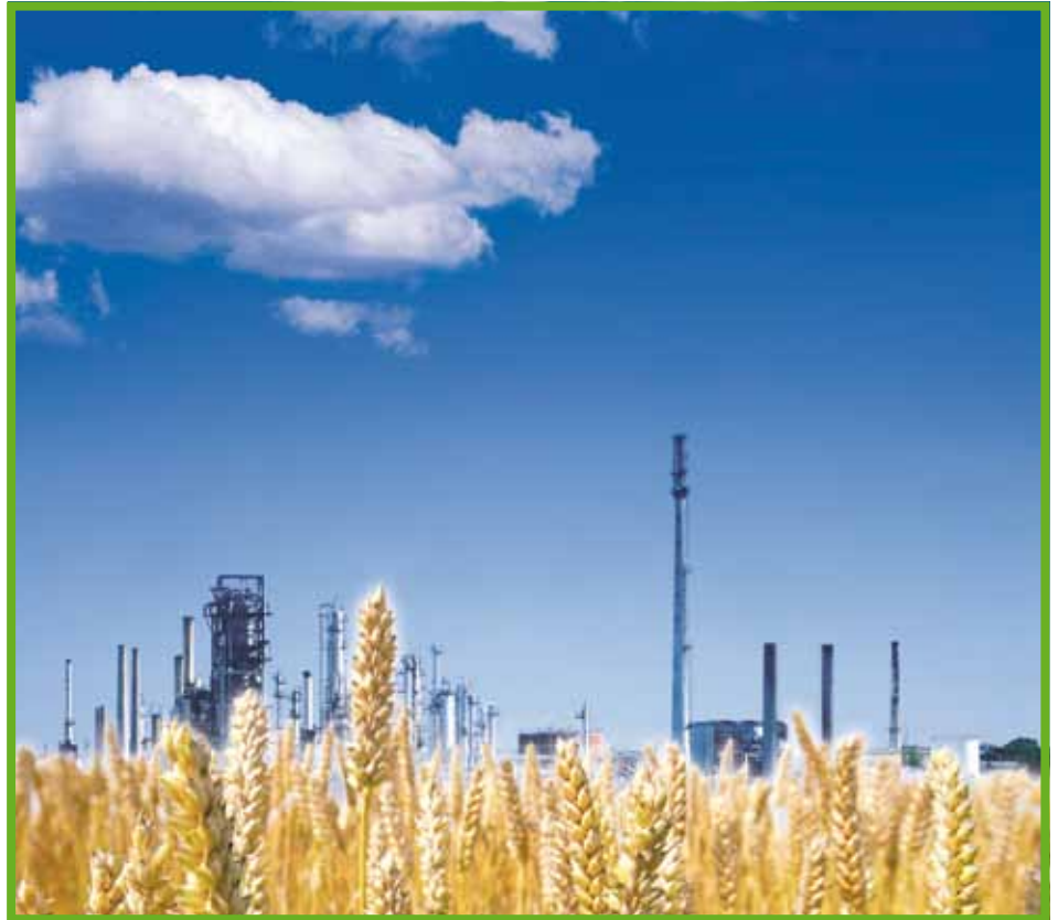
Die novellierte TA Luft soll für eine saubere Umwelt sorgen.

verfügt, kann es auf die Technischen Händler vor Ort zurückgreifen. Der hat den heißen Draht zum Anwendungstechniker der herstellenden Industrie. Die Hersteller TA Luft-konformer Dichtungen bieten wirtschaftliche und saubere Lösungen an bzw. schulen selbst. Dazu gehören eine kostengünstige Anlagenausrüstung, die Vermeidung von Folgekosten und teuren Medienverlusten. In der Reduzierung der Medienverluste liegt denn auch ein enormes Einsparungspotenzial, das nicht nur „gefühl wahrnehmbar“ ist, sondern präzise gemessen und nachgewiesen werden kann. Hier stehen bewährte Rechen-Tools bereit. Denn die Devise lautet: Die Luft ist rein, wenn alles dicht ist.