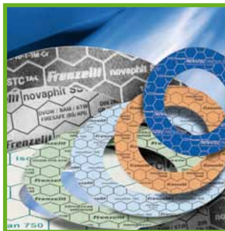
Dichtungskompetenz für die Industrie: TA Luft-konforme gestanzte Dichtungen von Frenzelli.

sen. Die Richtlinien VDI 2200 und VDI 2440 geben Hilfestellung bei der Auswahl von Dichtelementen. Durch die TA Luft wurde das Prüfungsverfahren nach Beantragung einer Änderungsgenehmigung auf die gesamte Anlage und sämtliche Verfahrensschritte ausgeweitet. Dichtungen, die z. B. in Raffinerien oder in den Pipelines der Petrochemie eingesetzt werden, müssen