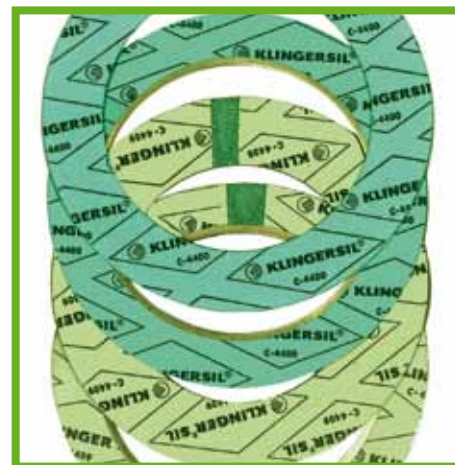
Eine Auswahl TA Luft-zugelassener Dichtungstypen von KLINGER.

arbeitet wird. Zudem greift – etwa in raffineriefernen Tanklagern – die so genannte „Absterbensregel“: Eine einmal eingebaute Dichtung wird, auch wenn sie nicht TA Luftkonform ist, erst bei notwendigen Umbaumaßnahmen oder im Leckagefall ersetzt, dann jedoch zwingend erforderlich durch eine hochwertige TA Luftkonforme Dichtung. Natürlich ist jede Technik nur so