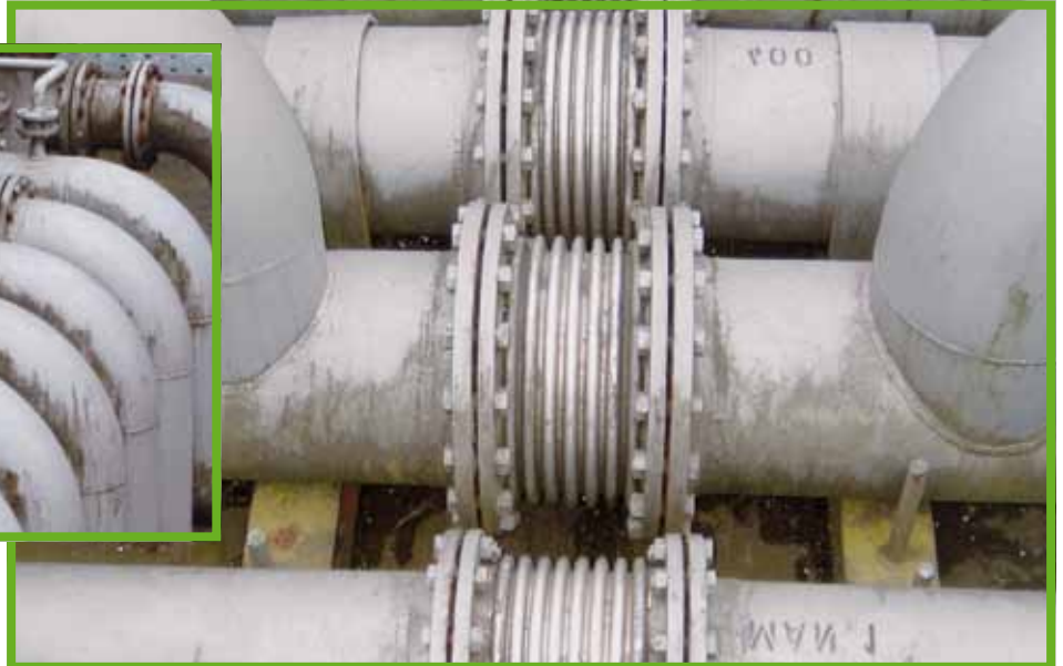
Kräfte im Rohrsystem erschweren ebenso die Montage und müssen über Kompensatoren möglichst gut abgefangen werden.

verunreinigungen, um ein hohes Schutzniveau für die Umwelt insgesamt zu erreichen.“