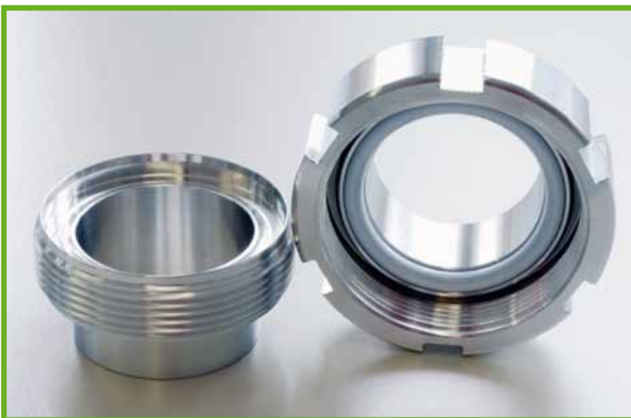
Die standardmäßig eingesetzte Milchrohrverschraubung nach DIN 11851 genügt den heutigen Anforderungen nicht mehr. RS Roman Seliger aus Norderstedt bei Hamburg entwickelte die TA Luft-konforme Verschraubung TAL-Connect als neue Standardverschraubung.

anlagen wurde zugleich EU-Recht umgesetzt. Der Emissionsteil enthält Ausführungen zu Vorsorgeanforderungen. Hier geht es um schädliche Umwelteinwirkungen und um entsprechende Emissionswerte bezüglich aller relevanten Luftschadstoffe. Dabei ist die TA Luft nicht nur eine Hürde für Neuanlagen, sie ist auch gewissermaßen der TÜV für Altanlagen, die nun nach Ablauf der Übergangsfrist „runderneuert“ werden müssen. Anders gesagt: Beim nächsten Prüftermin muss das Ersatzteil TA Luft-konform sein.